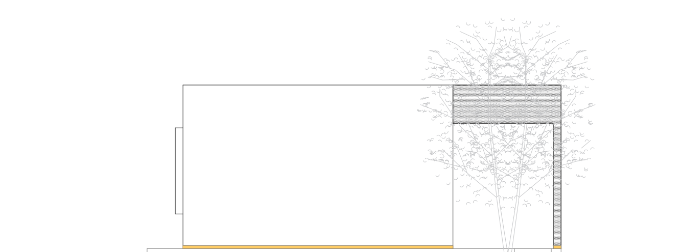
FACHADA LAT. DER. ESCALA 1:100