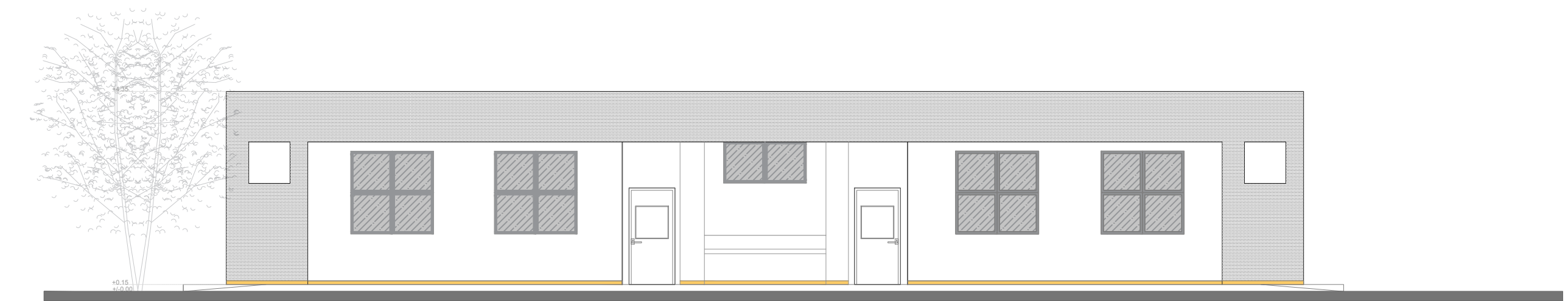
FACHADA FRONTAL ESCALA 1:100