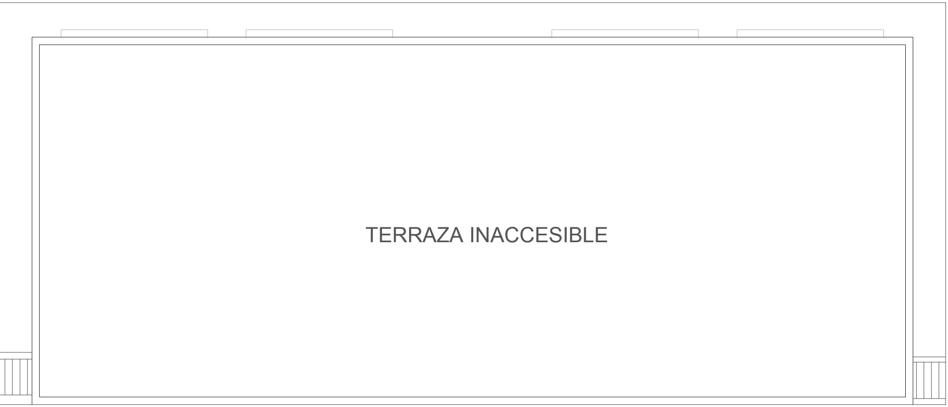
IMPLANTACION ESCALA 1:100